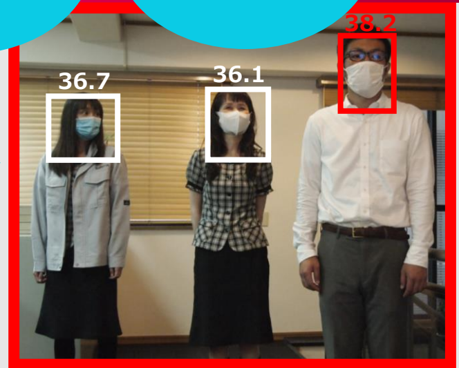
アラート時モニター表示画像