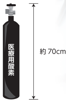
New かんたん O 2 タイガー 10ℓ酸素ボンベ専用モデル